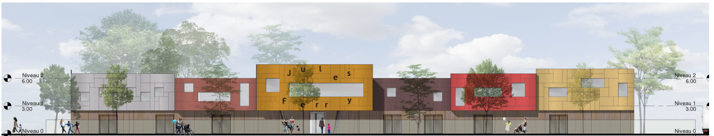
Façade sur rue